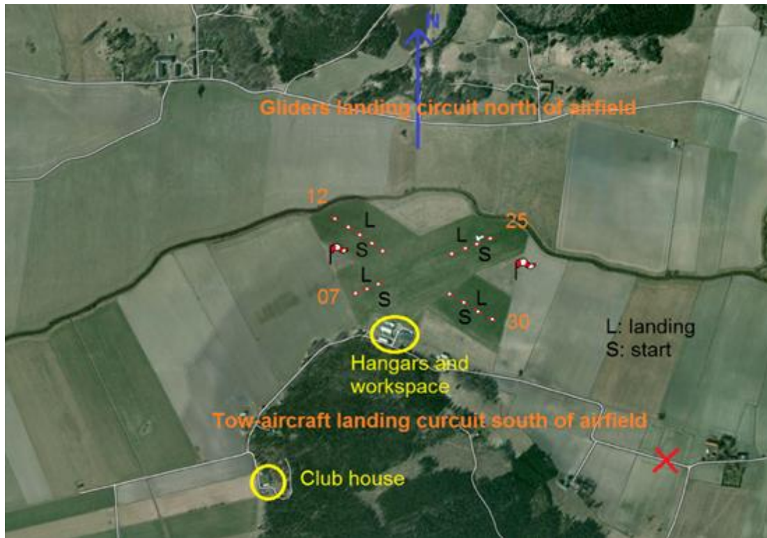
Långtora flygfält, flygfoto

TMG hänvisas till att använda motorn så lite som möjligt i närheten av fältet rent generellt och bullerområdena måste respekteras.