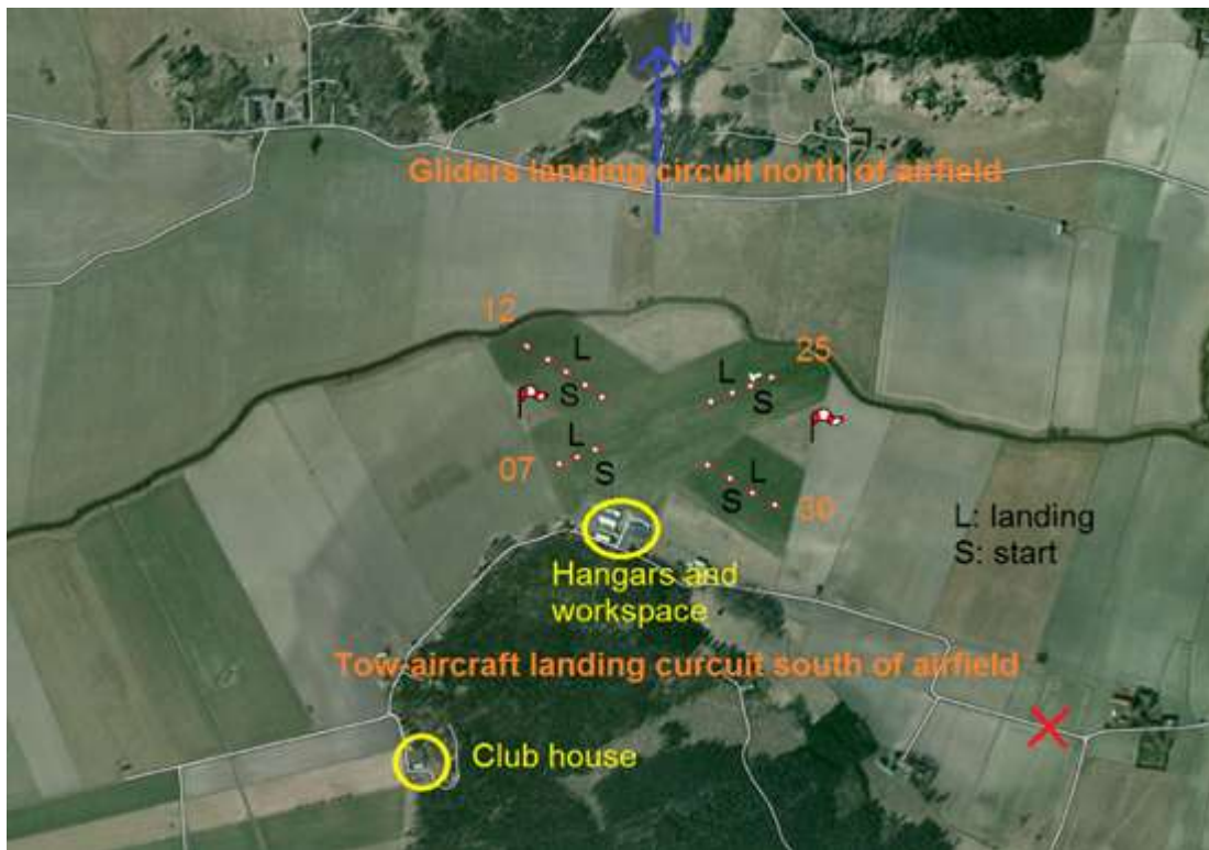
Långtora flygfält, flygfoto

TMG hänvisas till att använda motorn så lite som möjligt i närheten av fältet rent generellt och bullerområdena måste respekteras.